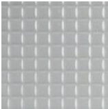
Soft Industrial Glass